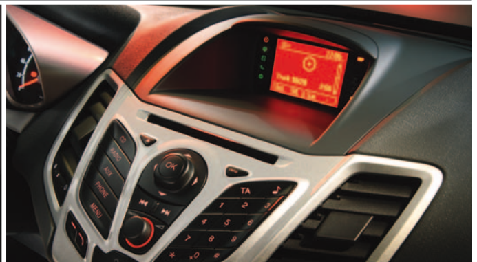
Audiosystem Radio-CD (MP3-fähig) und Mobiltelefon-Vorbereitung mit Bluetooth®-Schnittstelle