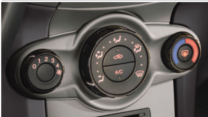
Klimaanlage, manuell, inkl. Umluftschaltung