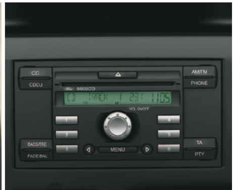
Audiosystem 6000CD mit Fernbedienung an der Lenksäule