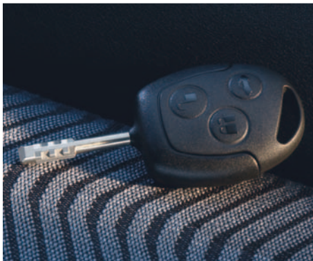
Fernbedienung für Zentralverriegelung